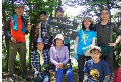
【頂上に登って来たばかりで息つくまもなく撮っていただいて御免なさい】