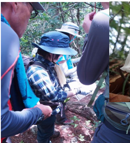
【地図読みしながら進みました】