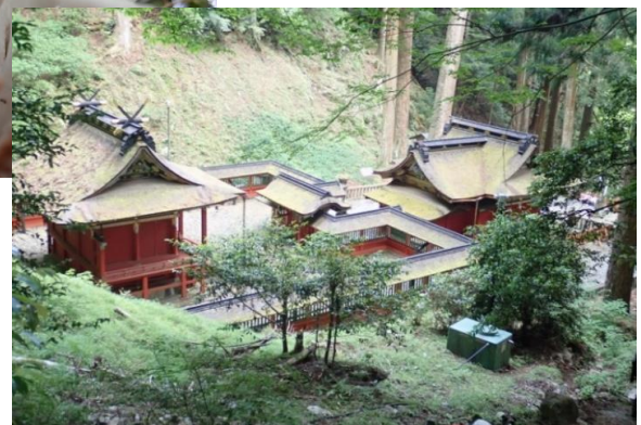
【東照宮を見下ろしちゃった】

下山は、皆で所々地図読みしながら楽しく歩行しました。途中、ブヨブヨし思ったより堅いユウレイタケにも出会うことができました。東照宮に到着後は早速御朱印をお願いするメンバーもいました。湯谷温泉下山後、次の電車までの間、日帰り温泉で汗を流すチームと足湯につかるメンバーと別れそれぞれ疲れを癒やし、名古屋に戻りました。